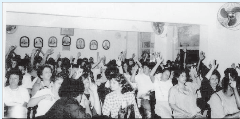
Assembleia no Sindicato dos Aeroviários na década de 1980

Naquele tempo também o colegiado da ASFIA tinha que peitar alguns diretores da FIA, principalmente os de unidades, porque estes ditadores,