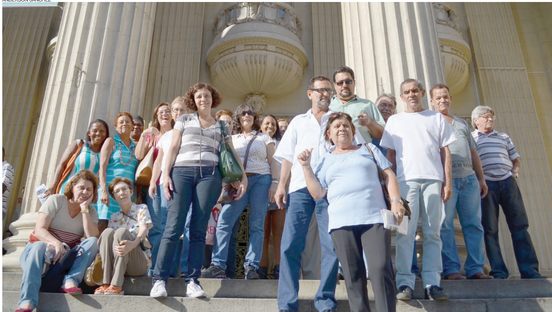
Servidores da FIA e diretores da ASFIA na Alerj