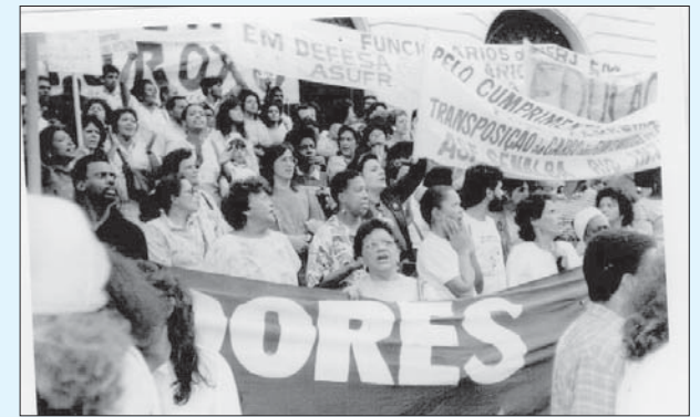
Ato de protesto nas escadarias da Câmara dos Vereadores na década de 1990

usando da caneta e o terrível documento chamado FAP ameaçavam aos servidores com corte de ponto e transferências para locais distantes infelizmente, ainda temos alguns diretores arbitrários, que usam o cargo para dizer que quem "manda sou eu".