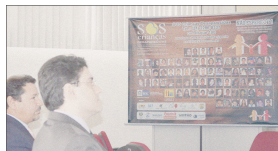
Novo cartaz do Programa SOS também foi lançado no evento