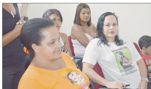
Mãe mostra a camisa com foto da filha desaparecida