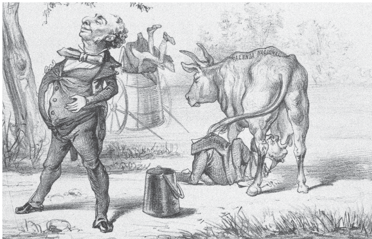
Charge de 1888 mostra um Liberal mamando nas tetas da Fazenda Nacional

A sinfonia da Coordenação do Polo de Articulação do Rio de Janeiro (PAR/RJ) desafinou de vez. Trocaram uma coordenadora com capacidade técnica, mas que não aparecia para trabalhar e nada coordenava, por outra (sua antiga assistente administrativa), que pouco aparece para trabalhar. Ela quer coordenar, mas não tem formação acadêmica e vivência (experiência) para coordenar tecnicamente os técnicos de longa carreira da FIA.