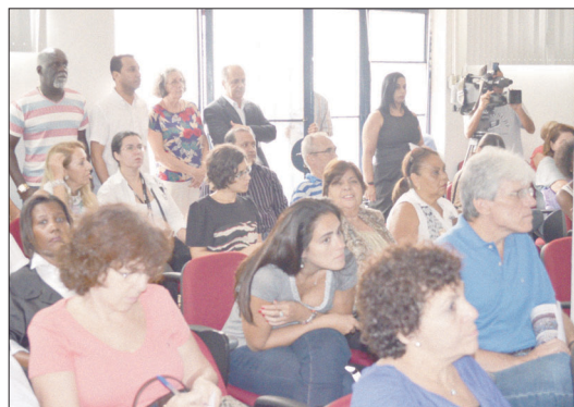
A Diretoria da ASFIA no lançamento do site do SOS