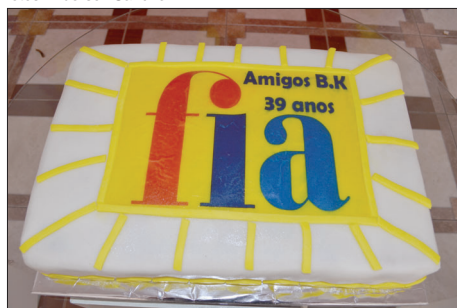
O bolo para comemorar não poderia faltar

Os servidores e ex-alunos do CAI (Centro de Atividades Integradas) Bernhard Kaden, em Antares, Santa Cruz, zona oeste do Rio, celebraram 39 anos do início de trabalho na unidade própria da FIA (Fundação para a Infância e Adolescência).