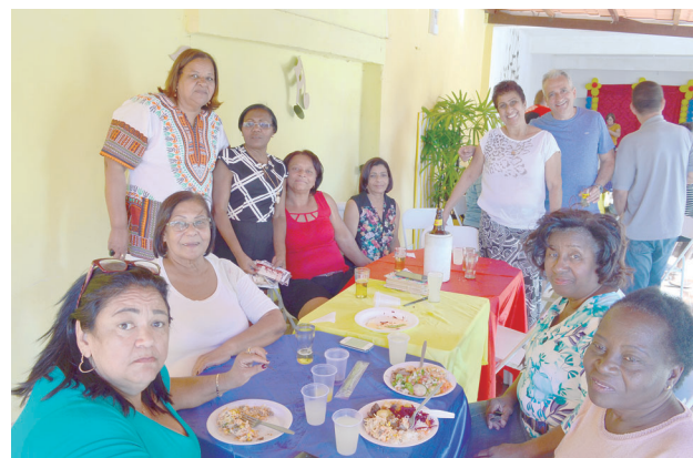
Servidores comemoram 39 anos da unidade Página 6