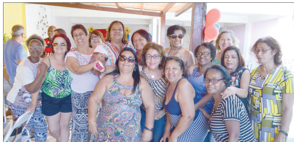
A alegria de rever amigos marcou a confraternização dos servidores da FIA BK