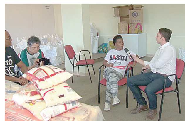
Vice-presidente fala das cestas básicas Página 8