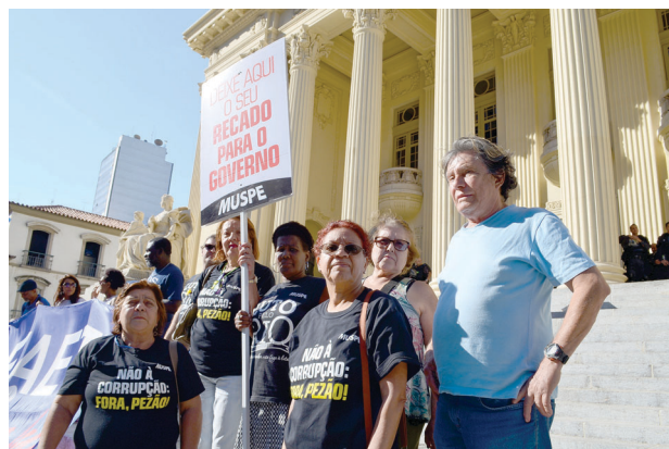
Diretoria em Ato Público na Alerj Página 7