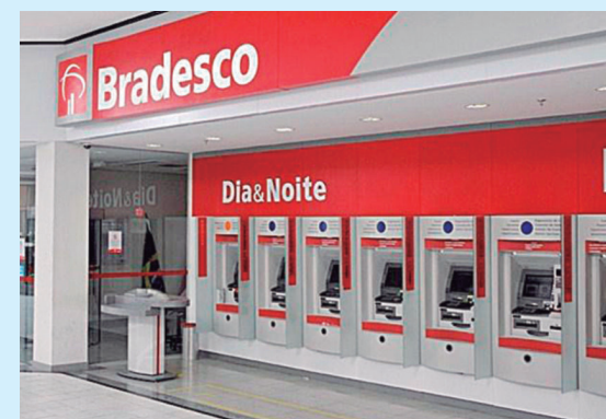
O Bradesco foi vencedor da licitação realizada no dia 11 de agosto

como também para os servidores ativos da Secretaria de Cultura, incluindo os ser-