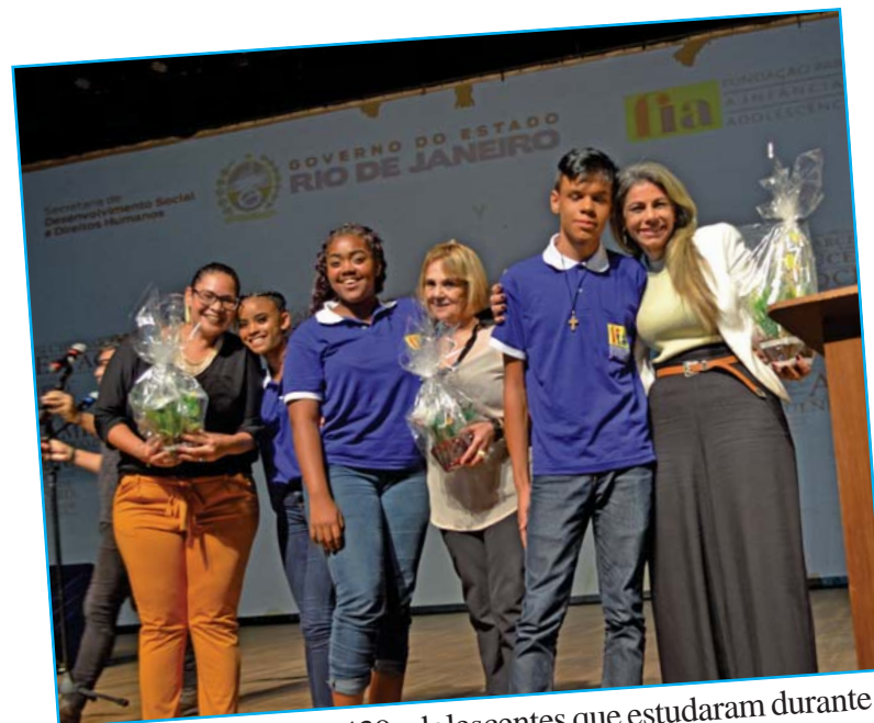
O curso formou 439 adolescentes que estudaram durante quatro meses nas unidades da FIA.

Uma das principais reivindicações da ASFIA é a reestruturação do PTPA. Os jovens em situação de vulnerabilidade ganham por ter direitos respeitados e a sociedade ganha na prevenção à criminalidade. Em 23 anos, a FIA já encaminhou mais de 23 mil adolescentes para o mundo de trabalho.