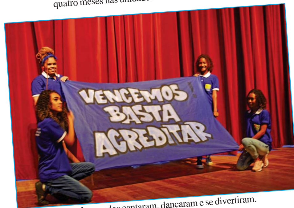
Os formandos cantaram, dançaram e se divertiram.

Uma das principais reivindicações da ASFIA é a reestruturação do PTPA. Os jovens em situação de vulnerabilidade ganham por ter direitos respeitados e a sociedade ganha na prevenção à criminalidade. Em 23 anos, a FIA já encaminhou mais de 23 mil adolescentes para o mundo de trabalho.